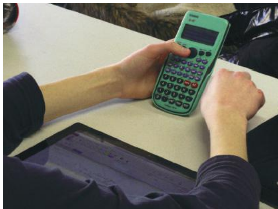
Fig. 4 Travail coordonné de tablette et calculatrice

Les élèves sont ainsi encouragés à plus utiliser leurs tablettes et à avoir recours au cahier comme accompagnement, comme brouillon, pour faire des calculs ou des essais. La tablette est devenue un outil ordinaire parmi les autres à disposition des élèves qui peuvent choisir comment les utiliser pour mener leur travail (Fig. 4). Ce choix réfléchi de l'outil de la part du professeur et de la part des élèves est un indice du fait qu'ils sont en train de se les approprier dans leurs pratiques d'enseignants et d'élèves.