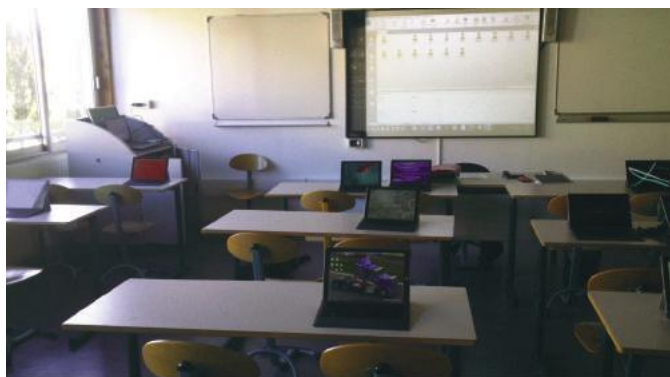
Fig. 1 Les écrans personnalisés dans la classe.

La première visite au collège a eu lieu quelques jours après que les tablettes eurent été livrées et déballées dans l'établissement. Nous avons suivi les élèves dans leur emploi du temps mais aussi pris le temps pour discuter avec les professeurs, en particulier pour présenter notre travail mais aussi pour recueillir l'état d'esprit et les choix de l'équipe pédagogique en ce début d'expérience. Ainsi, l'équipe de professeurs de la classe tablette s'est mise d'accord sur un fonctionnement qui sera pérennisé tout au long de l'année : les élèves laissent au collège leur tablette tous les soirs et la reprennent avec eux tous les matins. Dans la journée, chaque élève est responsable de sa tablette qu'il retrouve tous les jours (les fonds d'écran personnalisés le montrent bien !).