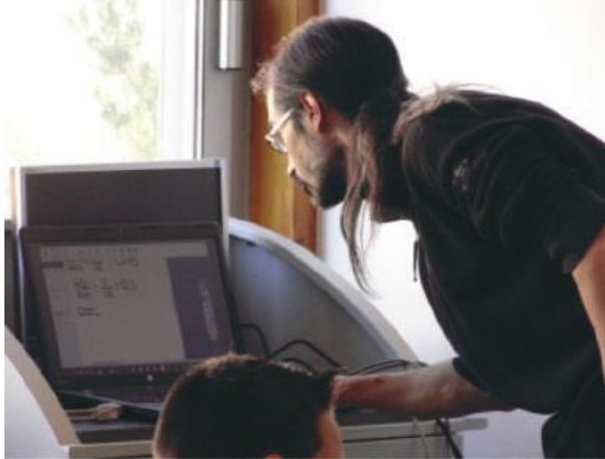
Fig. 3 Le professeur a accès au travail des élèves depuis son ordinateur

tablettes pour qu'il puisse ensuite récupérer leurs propositions en faisant des captures d'écrans depuis son ordinateur (Fig. 3).