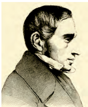
Pierre-François Verhulst 1804 - 1849

Leur propriété qui effrayait tant Malthus est la rapidité de leur croissance : si rien ne venait à l'interrompre, celle-ci en viendrait vite à transformer en êtres humains chaque morceau de la Terre, ce qui est évidemment impossible. D'où l'idée d'une inévitable catastrophe malthusienne , qui brise sans pitié la croissance démographique d'une manière ou d'une autre : famine, guerre...