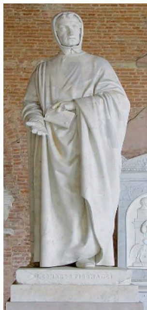
Leonardo Fibonacci 1175 -1250

Dans le Liber Abaci ( Le Livre du calcul ), l'ouvrage où Fibonacci mentionne cette devinette, l'énoncé et sa résolution prennent en tout à peine une page, qui n'est pas la plus difficile du livre ni la plus profonde. C'est pourtant ce seul passage qui vaut à Fibonacci une notoriété mondiale, tant la suite qui apparaît dans cette devinette s'est révélée fondamentale en théorie des nombres.