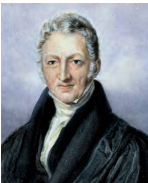
Thomas Malthus 1766 - 1834

Les premiers démographes du XVII e siècle utilisent abondamment les suites géométriques, notamment pour répondre à d'étranges questions d'exégèse biblique (nombre de descendants du couple originel, nombre d'Ébreux en Égypte avant l'Exode...).