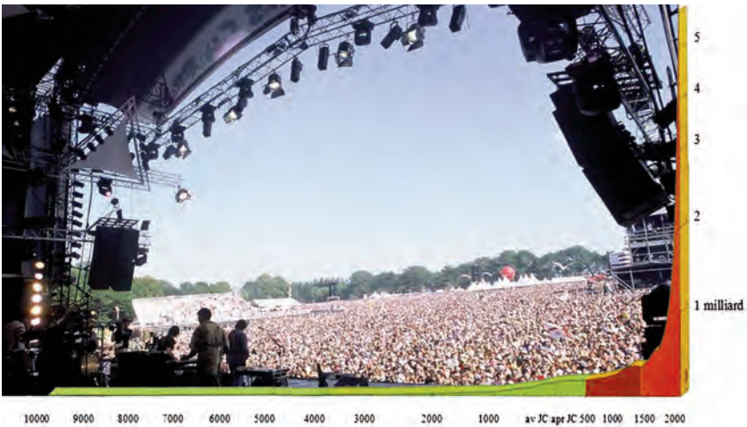
Courbe de croissance de la population mondiale © Robert Laffont Photo Festival des Vieilles Charrues © Pierre Iglésias

L'équation différentielle p'(t)/p(t) = c est l'une des plus simples et aussi des plus fondamentales qui soit. Ses solutions sont les fonctions exponentielles de la forme p(t) = p_0 \cdot e^{ct} , où p_0 est la population au temps 0 et où e est la base du logarithme népérien (soit environ 2,7). Une telle fonction donne à voir une courbe dont le comportement est qualitativement identique à celui d'une suite géométrique.