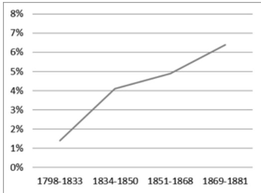
Figure 2 - Part de personnages féminins dans les manuels du primaire, par période

tabilisés contre 8712 personnages masculins, soit 5,7% 26 . Cette part des femmes apparaît évidemment particulièrement faible ! Les femmes sont donc quasiment inexistantes dans ces manuels d'arithmétique. Il faut toutefois noter une augmentation de la place des femmes dans les manuels au fil du 19 ème siècle. De fait, la part des femmes passe de 1,4% à 6,4% entre la première et la dernière période analysée.